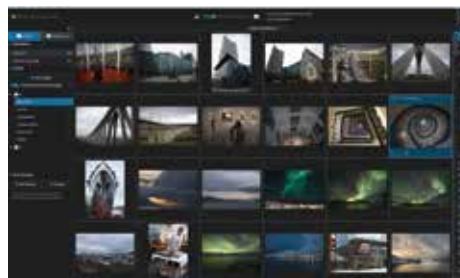
Ulrich Walter: „Mit der neuen Ästhetikfunktion der Excire 2024 lassen sich Rangfolgen erzeugen.“

gen Fällen fand sich exakt das gleiche Ergebnis bzw. die Rangfolge der Fotos war kaum anders. Fazit: es lohnt der Wechsel von Excire 2022 auf Excire 2024 mit seinen zusätzlichen, sehr nützlichen, neu entwickelten Funktionen.“